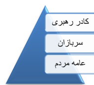
(شکل ۱: نظام طبقاتی جامعه مجاهدین خلق (منافقین))

۳- تبیین جایگاه کنشگران اجتماعی برای مجاهدین خلق از اهمیت بالایی برخوردار بود؛ از این رو گام دوم مجاهدین خلق در بازتولید ایدئولوژی‌شان، بهره‌گیری از مؤلفه‌های فعال‌سازی، طبقه‌بندی و تفکیک کنشگران اجتماعی بوده است. در ترجمه آنان، سه طبقه بر اساس هویت کنشگران اجتماعی بازنمایی و ارزش‌دهی شده‌اند که در شکل زیر نشان داده شده است: