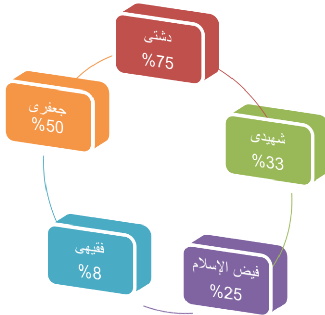
نمودار شماره ۱

همان گونه که در مقدمه اشاره نمودیم، افزون بر دوازده واژه انتخابی پیش گفته، با استناد به یکصد ۴ واژه انتخابی دیگر از خطبه‌های نهج البلاغه، کوشیده‌ایم تا علاوه بر بررسی عملکرد مترجمان، به ضریب خطای مترجمان در یافتن معادلی دقیق و متناسب با معنای ارجاعی آن واژگان نیز دست یابیم. در این بررسی، به دلیل محدودیت این جستار، تنها به ذکر نتایج به دست آمده از بررسی این واژگان اشاره خواهیم نمود. شایان ذکر است که نتایج به دست آمده، از شباهت محسوسی با نمودار فوق برخوردار است که حاصل بررسی این یکصد واژه را به شکل ذیل ارائه می‌نماییم: