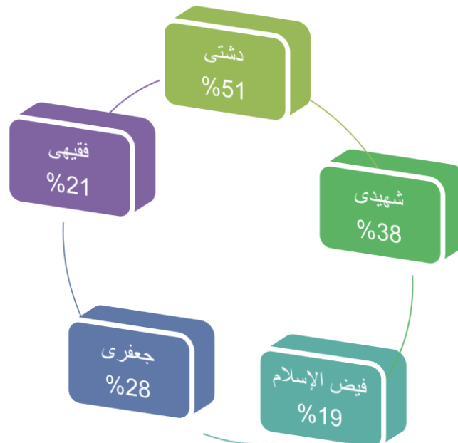
نمودار شماره ۲