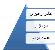
(شکل ۱: نظام طبقاتی جامعه مجاهدین خلق (منافقین))

۳- تبیین جایگاه کنشگران اجتماعی برای مجاهدین خلق از اهمیت بالایی برخوردار بود؛ از این رو گام دوم مجاهدین خلق در بازتولید ایدئولوژی‌شان، بهره‌گیری از مؤلفه‌های فعال‌سازی، طبقه‌بندی و تفکیک کنشگران اجتماعی بوده است. در ترجمه آنان، سه طبقه بر اساس هویت کنشگران اجتماعی بازنمایی و ارزش‌دهی شده‌اند که در شکل زیر نشان داده شده است: